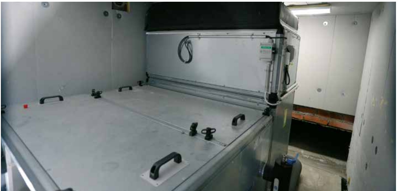
RETCARE IN E -poistoilmakone asennettuna puhallinkammioon.