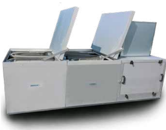
RETCARE OUT E -poistoilmakoneen toiminto-osien huolto tapahtuu osan päällä tai sivulla sijaitsevien huoltoluukkujen kautta.