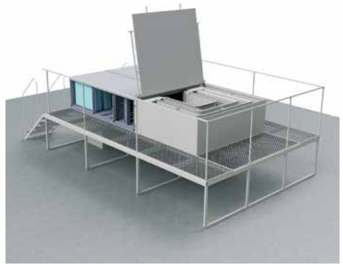
RETCARE OUT S -tuloilmakone ja koneen huoltoja varten tarvittavat hoitotasot.

RETCARE OUT S tuloilmakoneesta on kolme eri konekoko. Konekoko määräytyy ilmamäärän perusteella. Puhallinosassa on kaksi rinnakkaista EC-moottorilla varustettua puhallinta. Alla on taulukko alustavaa konevalintaa varten. Projektikohtaisista mitoitusdokumenteista löytyvät laitteen tarkat tiedot.