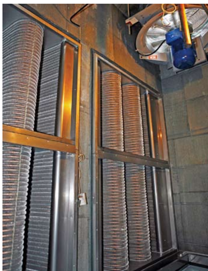
Bild 2. RETERMIA'S VÅV-FÖRFILTER installerat istället för luftintagsgaller. VÅV-förfilter skyddar F7-huvudfiltret från fukt, is och mikrober.