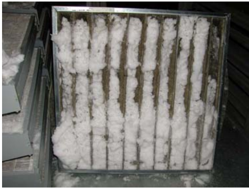
Kuva 1. Lumesta tukkeutunut pussihienosuodatin.

Lumen kerääntyessä toistuvasti kammi-oon voi lumen pinta ylettyä sulkupeltien ja suodattimien tasolle ja pahimmillaan tukkia sulkupellit ja suodattimet (Kuva 1). Tällä tavoin lumesta sulanutta vettä voi joutua suodattimille ja muualle ilmanvaihtojärjestelmään. Lumen tunkeutuminen ilmanvaihtojärjestelmän sisälle on todennäköisintä, jos virtausnopeus ulkoilmasäleiköllä on liian suuri tai raitisilmakammio on pieni tai puuttuu kokonaan (Halonen ym., 2000).