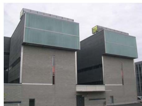
Kuva 3. Lumen ja muiden epäpuhtauksien kulkeutumista estäviä sääsuoja esimerkkikohteessa.

Tuulen vaikutusta lumesta johtuviin ilmanvaihtojärjestelmien käyttöhäiriöihin ja hygieniaongelmiin ei ole tutkittu, mutta sen vaikutus lumen aiheuttamiin ongel-