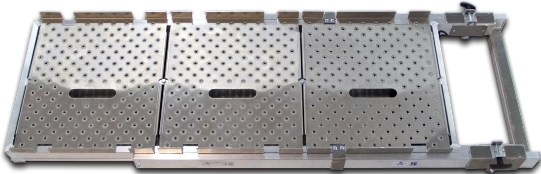
Retermia neulalämmösiirtimen päälle asetettava kulkutaso

Retermia toimittaa laitetoimituksen mukana laitteen päälle huollon ajaksi asetettavan kulkutason, jos laitteen turvallinen huolto sitä edellyttää.